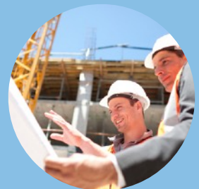
Reporte en Campo